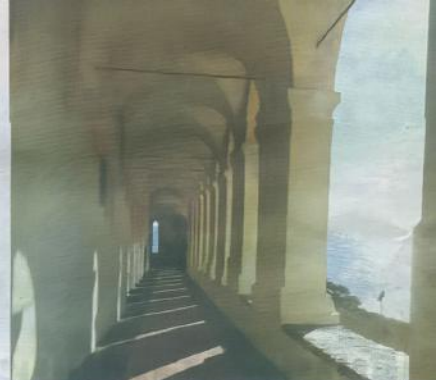
I Imperia er der masser af mulighed for at få finde svalende skygge, men havet er #er stort set udsigt til hele tiden.