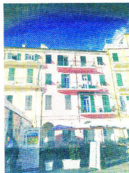
Bygningerne i Imperia er malet i de klassiske pastelfarver.

Men uanset om man er der under eller uden for festivalen, kan man spise godt i Imperia. Her er nemlig et væld af restauranter,